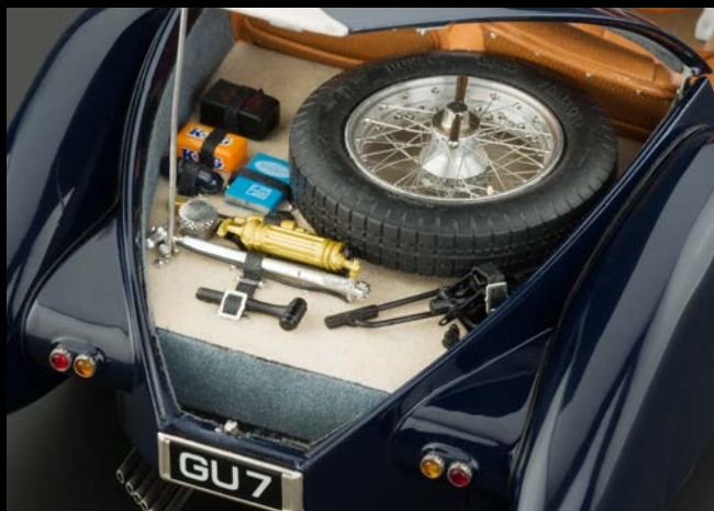
Im abschließbaren Kofferraum sind Wagenheber, Luftpumpe, Fettpresse, Teileboxen und Werkzeugsatz als Miniaturen hinterlegt.