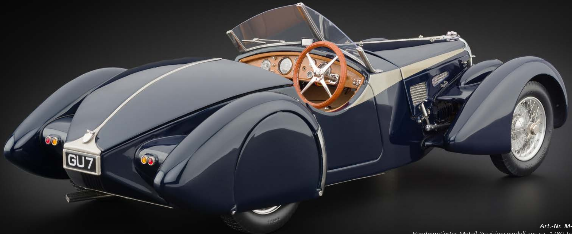
Art.-Nr. M-106 Handmontiertes Metall-Präzisionsmodell aus ca. 1780 Teilen. Eine betörende Modell-Schönheit, die in keiner Oldtimer-Sammlung fehlen darf.