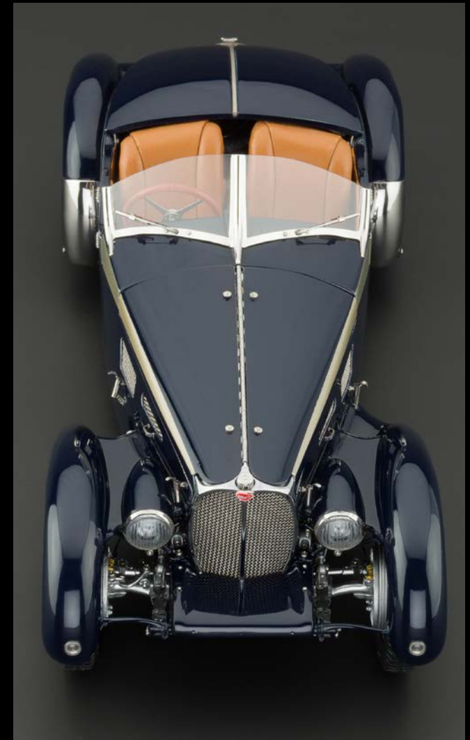
Vorbildgetreue Darstellung der markanten Fahrzeug-Frontpartie mit den ästhetisch integrierten Scheinwerfern.